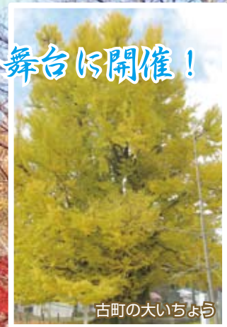
古町の大きいちよう